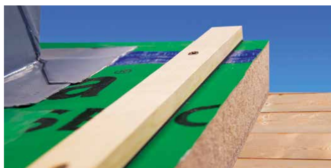
Applicazione di USB TIP Kont (a norma UNI 11470:2013 )