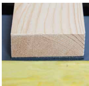
USB TIP Kont 80