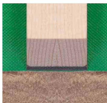
USB TIP Kont 60