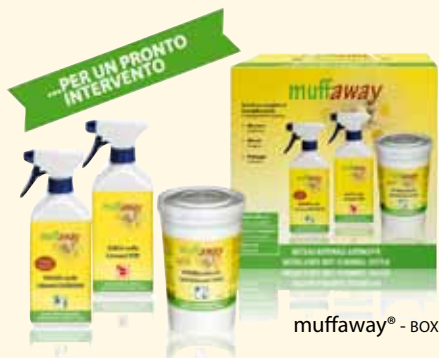
muffaway® - SISTEMA ANTIMUFFA

Naturalia-BAU propone, al contrario, due soluzioni 100% naturali: